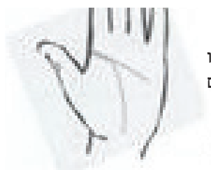
חיבור ארוך של קו הראש עם קו החיים